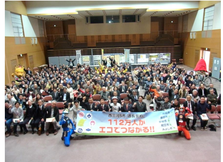
西三河5市「アクションプラン」発表イベント (2017年3月12日、豊田市内)

日本版「首長誓約」 (CoMJ) 愛知県西三河地域5市 (第1号) 2015年12月 岡崎市、豊田市、安城市、知立市、みよし市 5 Cities in Aichi Prefecture (Okazaki, Toyota, Anjo, Chiryu, and Miyoshi) , 2015 長野県高山村 (第2号) 2016年8月 Takayama Village in Nagano Prefecture, 2016