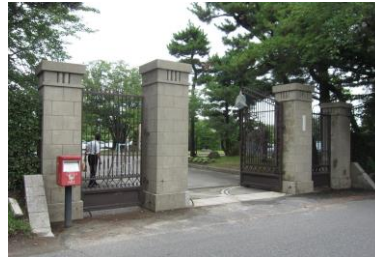
旧制中学正門の例