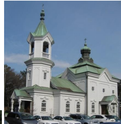
豊橋ハリストス正教会 (2008年国重文指定)